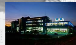
Excursii în Elveția