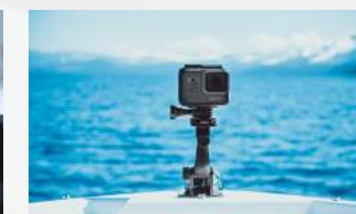
GoPro HERO6 Black